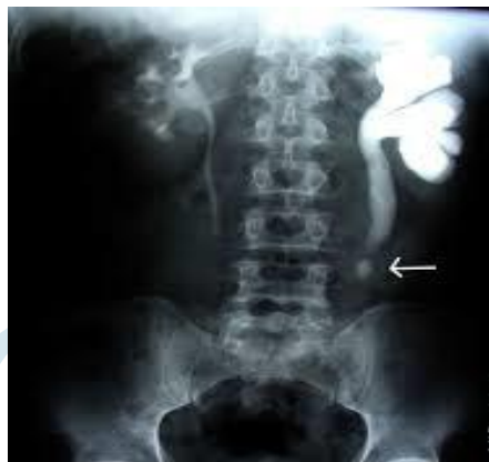
سنگ حالت میانی در یک عکس رنگی؛ توجه کنید که سنگ بعلت ایجاد انسداد نسب باد کردن و تورم کلیه شده است.

منظور از عکس یا رادیوگرافی ساده عکسی است که بدون کاربرد یک ماده خارجی به بدن گرفته می‌شود. در این روش، تفکیک حدود اعضاء از یکدیگر مشکل خواهد بود. در رادیوگرافی با مواد کنتراست با وارد نمودن مواد خارجی به بدن که نسبت به بافتهای نرم تراکم متفاوتی داشته باشند رنگ یکنواخت آن قسمت را بهم زده و تمایز رنگها حاصل می‌شود.